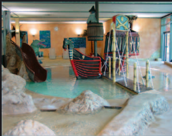
Piratenschiff, Figuren und Wasserlandschaft im Freizeitbad Immenstaad bilden den Kinderbereich.