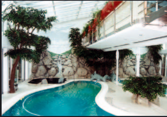
Bäume, Wasserfälle und integrierte Illusionsmalerei in einem privaten Schwimmbad in Wolstijn (Polen) schaffen Atmosphäre.